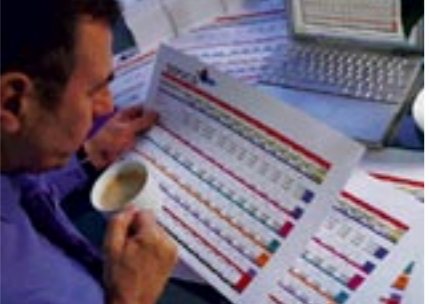
Hojas de cálculo en A3+