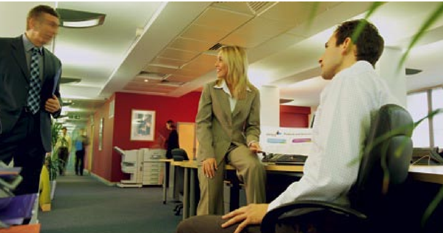
(Imagen con el Finisher opcional)