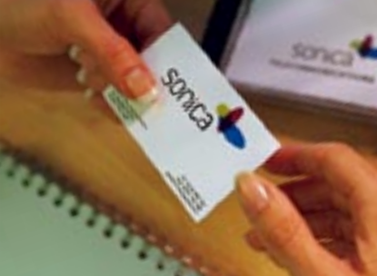
Tarjetas de visita