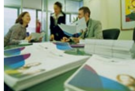
Catálogos grapados en el pliegue central